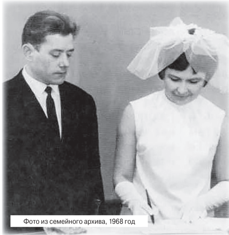
Фото из семейного архива, 1968 год